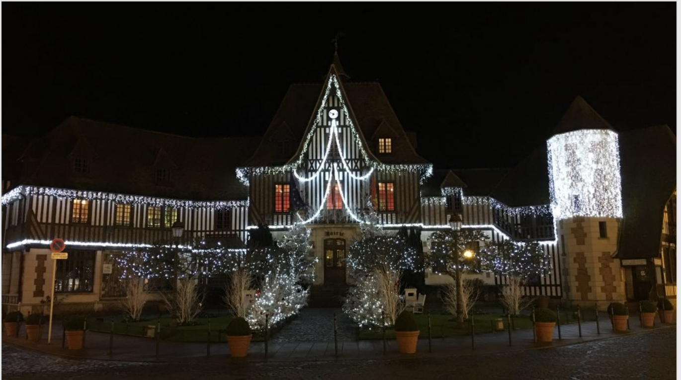
Mairie de Deauville